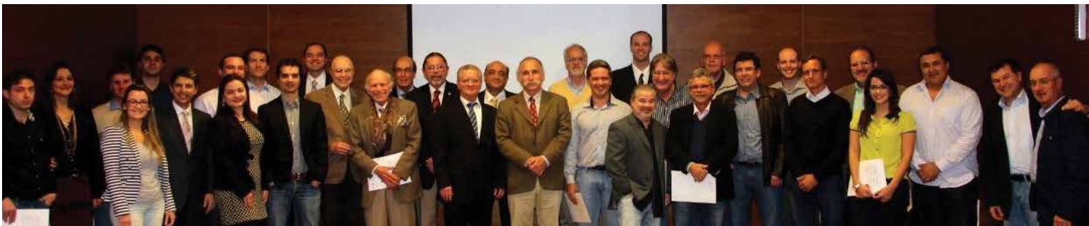
Encontro Catarinense de Angiologia, em agosto de 2013, em Florianópolis.